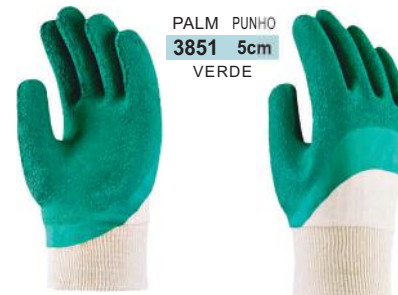
PALM PUNHO 3851 5cm VERDE

NITRILON C/ SUPORTE EM MALHA ACABAMENTO CORRUGADO, PUNHOS EM MALHA E DORSOS VENTILADOS