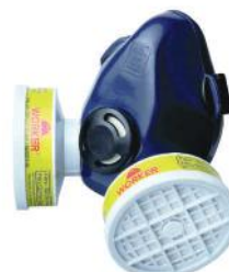
PALM FITRO 6436 2 NÃO ACOMPANHA FILTRO