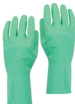
PALM TAMANHO 3845 P 3846 M 3847 G