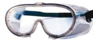
PALM 26112 RÃ PERFORADO INCOLOR