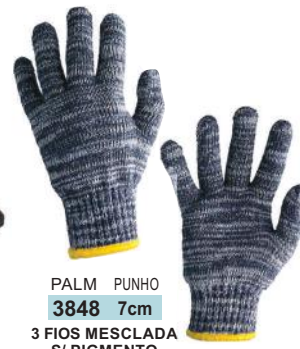
PALM PUNHO 3848 7cm 3 FIOS MESCLADA S/ PIGMENTO