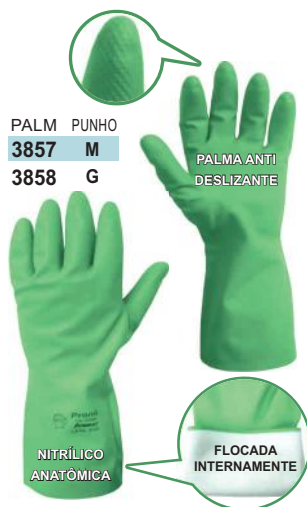
PALM PUNHO 3857 M 3858 G