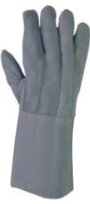
PALM PUNHO 29983 15cm 2ª LINHA CANO LONGO