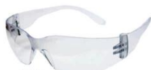
PALM 6862 LEOPARDO - INCOLOR