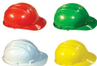
PALM DESCRIÇÃO CORES 3835 CARPINTEIRO AMARELO 3836 PEDREIRO AZUL 3837 ENGENHEIRO BRANCO 3838 VISITANTE VERDE 3839 AJUDANTE VERMELHO PLÁSTICO TIPO BONÉ - 3 ESTRIAS