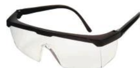
PALM CORES 3865 INCOLOR C/ HASTE REGULÁVEL