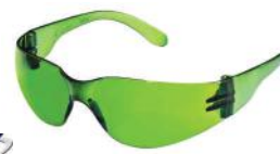
PALM 26100 LEOPARDO - VERDE