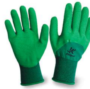
PALM TAMANHO 26092 M (8) 26093 G (9) 26094 XG (10) VERDE