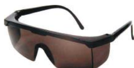
PALM 26095 POLICARBONATO RIO DE JANEIRO - FUME