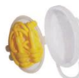
PALM 3868 SILICONE