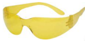
PALM 26097 LEOPARDO - AMARELO