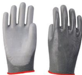
PALM PUNHO 12369 7cm

LUVA C/ FIOS NYLON, REVESTIMENTO DE POLIURETANO NA COR CINZA NAS PALMAS, FACE PALMAR DOS DEDOS E PONTA DOS DEDOS.