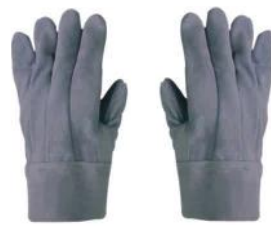
PALM PUNHO 3855 7cm 1ª LINHA CANO CURTO