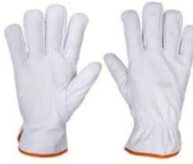
PALM PUNHO 7402 5cm CANO CURTO