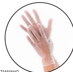
PALM TAMANHO 26070 P 26071 M 26073 G S/ PÓ