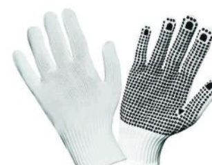
PALM PUNHO 12367 7cm