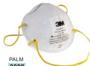
PALM 3828 8720