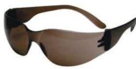
PALM 26098 LEOPARDO - FUME