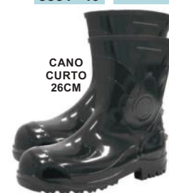
CANO CURTO 26CM