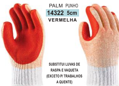
PALM PUNHO 14322 5cm VERMELHA

SUBSTITUI LUVAS DE RASPA E VAQUETA (EXCETO P/ TRABALHOS A QUENTE)