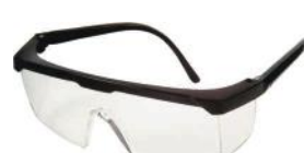
PALM 26096 POLICARBONATO RIO DE JANEIRO - INCOLOR