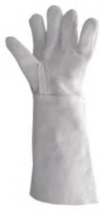
PALM PUNHO 26135 20cm 2ª LINHA CANO LONGO S/ REFORÇO