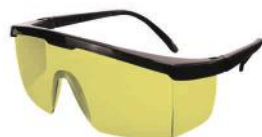
PALM CORES 3863 AMARELO C/ HASTE REGULÁVEL