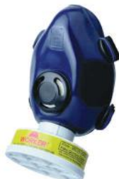
PALM FITRO 6435 1 NÃO ACOMPANHA FILTRO