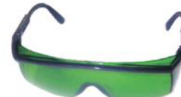
PALM CORES 3866 VERDE C/ HASTE REGULÁVEL