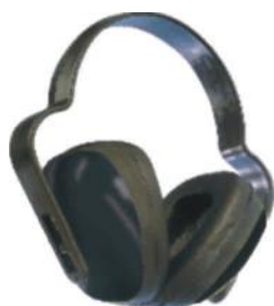
PALM CORES 3832 PRETO TIPO CONCHA C/ HASTE PLÁSTICA