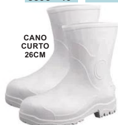
CANO CURTO 26CM