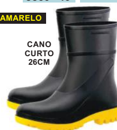
CANO CURTO 26CM