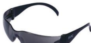
PALM 6864 LEOPARDO - FUMÉ