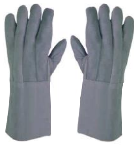
PALM PUNHO 3856 15cm 1ª LINHA CANO LONGO