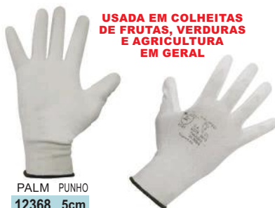
PALM PUNHO 12368 5cm

C/ REVESTIMENTO DE POLIURETANO NA COR BRANCA NAS PALMAS, FACE PALMAR DOS DEDOS E PONTA DOS DEDOS.