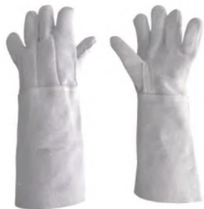
PALM PUNHO 26134 20cm 1ª LINHA CANO LONGO REFORÇO TOTAL