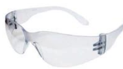
PALM 26099 LEOPARDO - INCOLOR