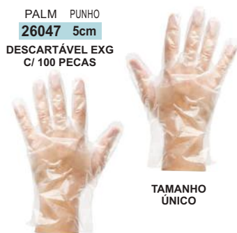
PALM PUNHO 26047 5cm DESCARTÁVEL EXG C/ 100 PECAS