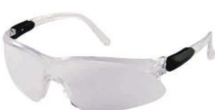
PALM 26102 INCOLOR