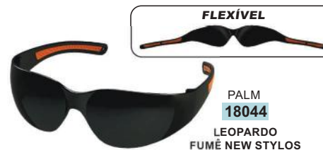
FLEXÍVEL PALM 18044 LEOPARDO FUMÉ NEW STYLOS