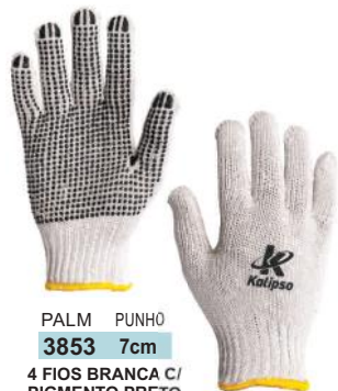
PALM PUNHO 3853 7cm 4 FIOS BRANCA C/ PIGMENTO PRETO