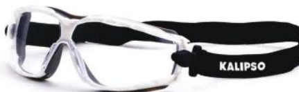
PALM 26114 ARUBA INCOLOR ANTIEMBAÇANTE