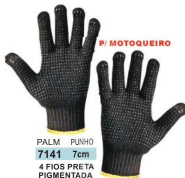
PALM PUNHO 7141 7cm 4 FIOS PRETA PIGMENTADA