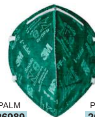
PALM 26989 PFF1 9901 VERDE