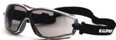
PALM 26113 ARUBA FUME ANTIEMBAÇANTE