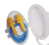
PALM 3867 COPOLIMERO