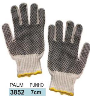
PALM PUNHO 3852 7cm 3 FIOS BRANCA C/ PIGMENTO PRETO