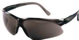
PALM 26101 FUME