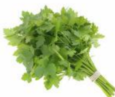
COD. 28501 SALSA LISA ENVELOPE