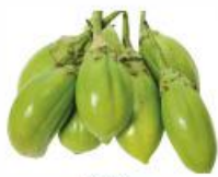
COD. 28488 JILÓ COMPRIDO VERDE CLARO ENVELOPE