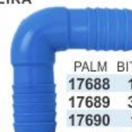
PALM BITOLA 17688 1/2" 17689 3/4" 17690 1" DUPLO