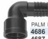
PALM BITOLA 4686 1/2" 4687 3/4" 4685 1" INTERNO C/ ROSCA