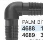
PALM BITOLA 4688 1/2" 4689 3/4" DUPLO