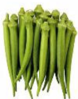
COD. 28496 QUIABO SANTA CRUZ ENVELOPE