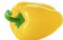
COD. 28495 PIMENTÃO AMARELO ENVELOPE