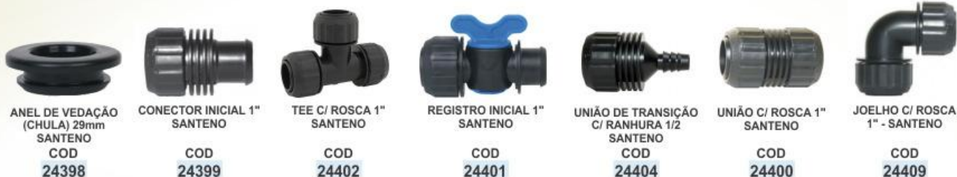
ANEL DE VEDAÇÃO (CHULA) 29mm SANTENO COD 24398