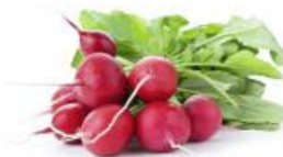
COD. 28497 RABANETE VIP ENVELOPE