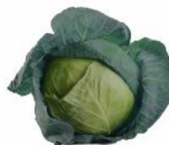
COD. 28498 REPOLHO 60 DIAS ENVELOPE