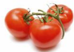
COD. 28505 TOMATE SANTA CRUZ ENVELOPE

NENHUM DE NÓS É TÃO BOM, QUANTO TODOS NÓS JUNTOS