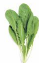
COD. 28499 RUCULA CULTIVADA ENVELOPE