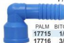
PALM BITOLA 17715 1/2" 17716 3/4" 17717 1" 17718 1.1/4" 17719 1.1/2" 17720 2" INTERNO C/ ROSCA