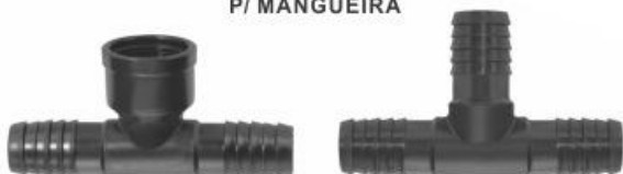
PALM BITOLA 4691 1/2" 4692 3/4" 4690 1" C/ ROSCA 90°