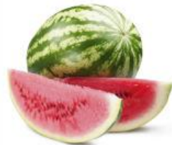
COD. 28489 MELANCIA CRIMSON ENVELOPE