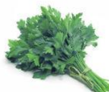
COD. 28502 SALSA GRAUDA ENVELOPE