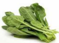
COD. 28500 RUCULA FOLHA LARGA ENVELOPE