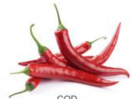
COD. 28491 PIMENTA MALAGUETA ENVELOPE