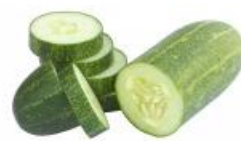
COD. 28490 PEPINO CAIPIRA (ESMERALDA) ENVELOPE